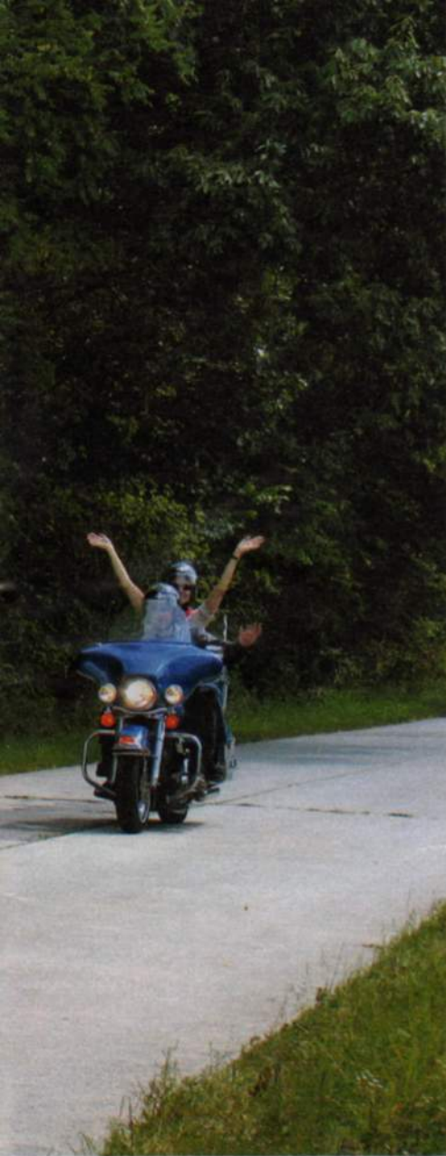
VANHAA Routen betonitietä löytyy vielä muutamista kohdista.

rivissä vuokraamon pihalla, ja jokaiselle annetaan pyörästä lyhyt käyttöopastus.