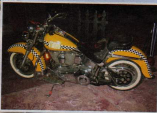
▲ TAKSEISSA on valinnanvaraa, tässä H-D-taksi.

▲ TEHOA ja vääntöä löytynee riittävästi.