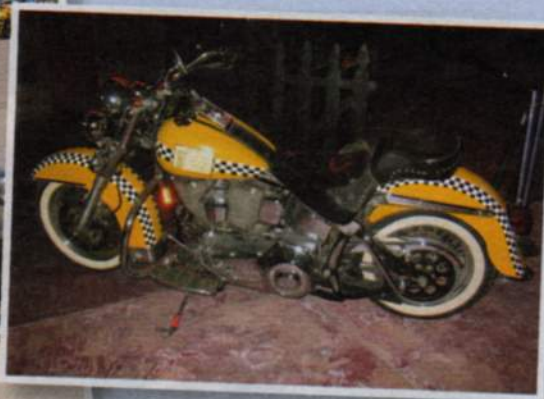
▲ TAKSEISSA on valinnanvaraa, tässä H-D-taksi.

▲ TEHOA ja vääntöä löytynee riittävästi.